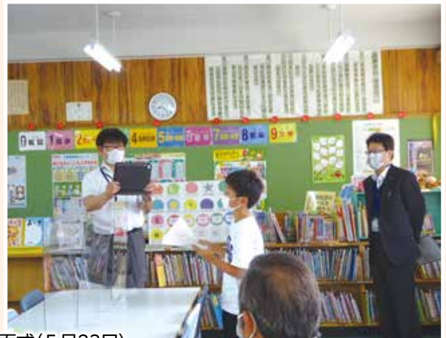
住吉南小学校対面式(5月23日)