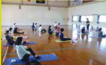
ピラティスでバランスボディ