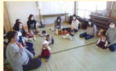
ママ、だぁーい好き!