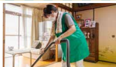
ボランティアセンターつなぎ(部屋の掃除) 月4回、定期的に伺っています。掃除やお買い物をお手伝いしています。