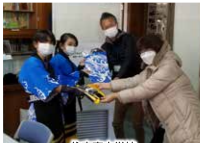
住吉南小学校 俵踊り復活プロジェクトへ衣装贈呈