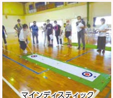
マインディスティック カーリング