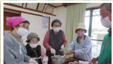
移動サロン・みんなで会食会 季節の料理をみんなで作ります