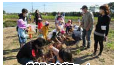
貸農園・つなぎファーム 秋の収穫祭ではお芋掘りをしました。契約者さん同士の交流も楽しみです。