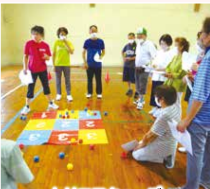
トリコロキューブ