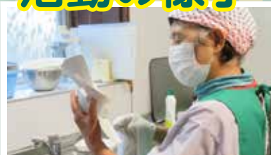
ボランティアセンターつなぎ(換気扇の掃除) 普段できない所もお手伝いします。