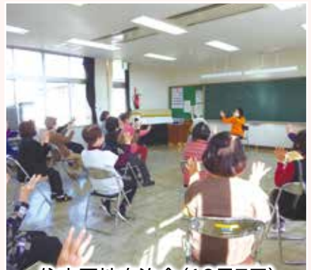
住吉団地自治会(12月7日)