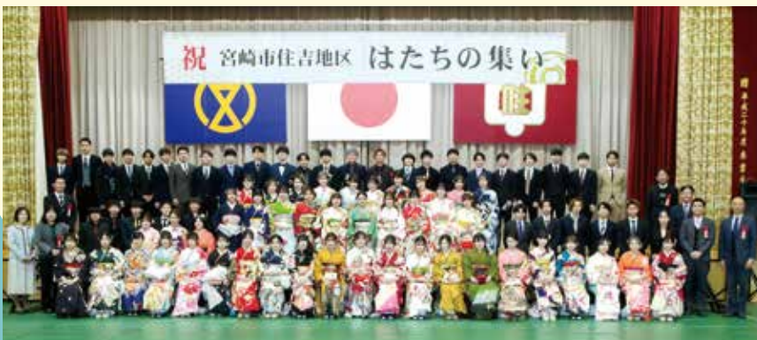
令和5年 住吉地区 はたちの集い (令和5年1月8日)