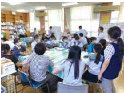
住吉中学校 住吉を語ろう!やってみよう! in住吉中2022