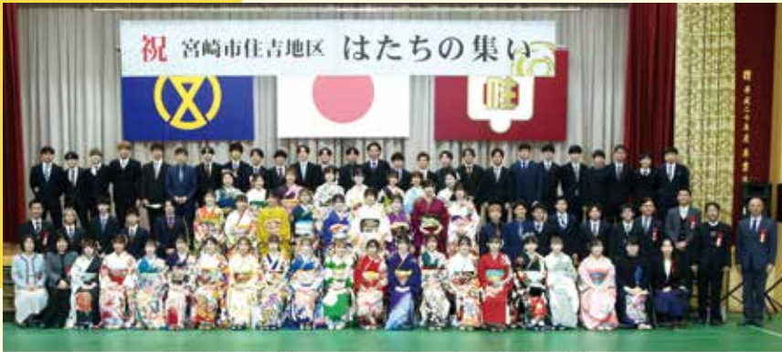
令和5年 住吉地区 はたちの集い (令和5年1月8日)

令和5年1月8日(日)に住吉地区「はたちの集い」を開催しました。3年ぶりに住吉中学校体育館で、145名の二十歳の皆さんを迎え、盛大に式典並びに地域行事を行うことができました。和やかな雰囲気の中で、晴れやかな二十歳の皆さんをお祝いすることができました。地域の皆様をはじめ関係者の皆様に感謝申し上げます。