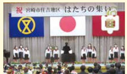
住吉南小学校 合唱部のみなさん