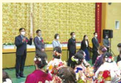
恩師お祝いのことば