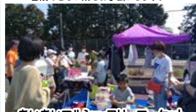
あいあいマルシェ・フリーマーケット ハンドメイド・リサイクル品で誰でもお店屋さん! 出店者も募集しています。