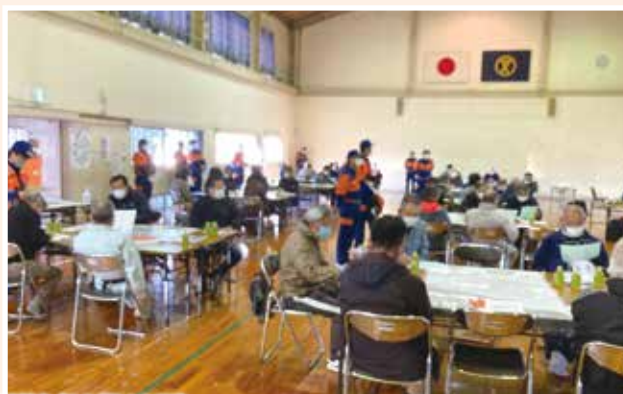
住吉地区総合防災訓練(12月10日)