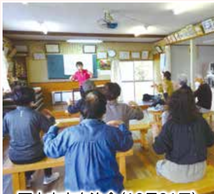
西土中方自治会(10月31日)