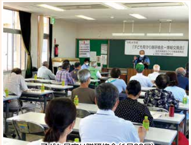
子ども見守り隊研修会(6月29日)