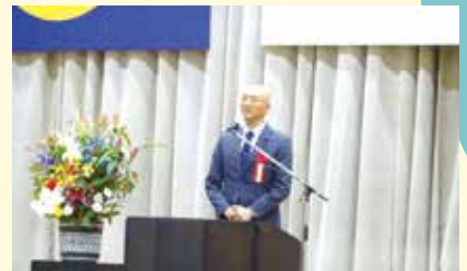
来賓あいさつ(県議会議員 日高陽一様)