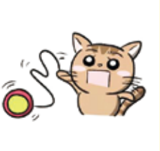
ヨーヨーで遊ぼう