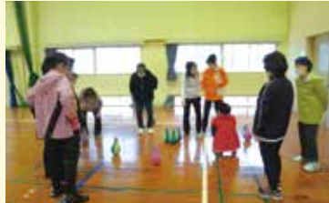
ニュースポーツ体験