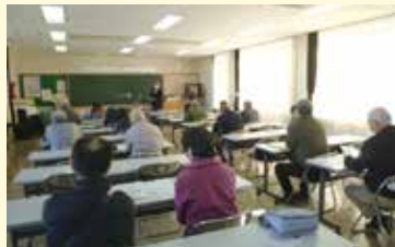
鎌倉殿の13人と宮崎の歴史