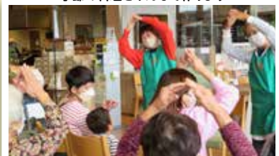
スミプレカフェ(ハーティながやま住吉店) 月に1回楽しい講座を準備しています