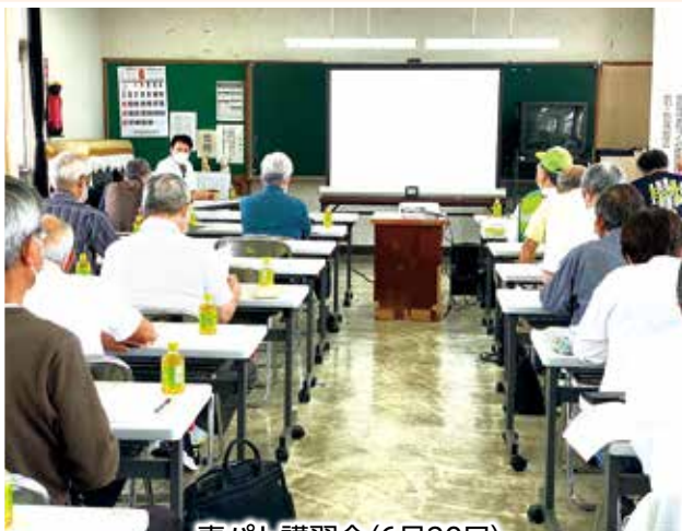
青パト講習会(6月20日)