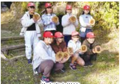
住吉南小学校 横穴古墳群PRプロジェクト