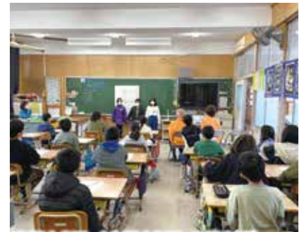
住吉小学校 総合的な学習にゲストティーチャーとして招かれました。(9月16日、10月13日、2月2日)