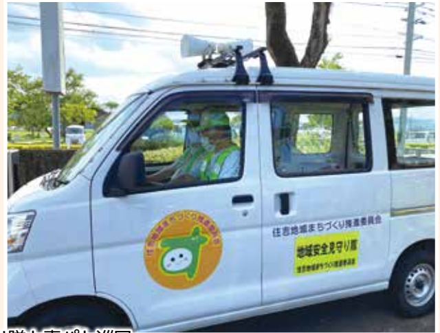
登下校時の見守り隊と青パト巡回