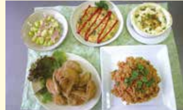
ワインなどにも合う季節の料理